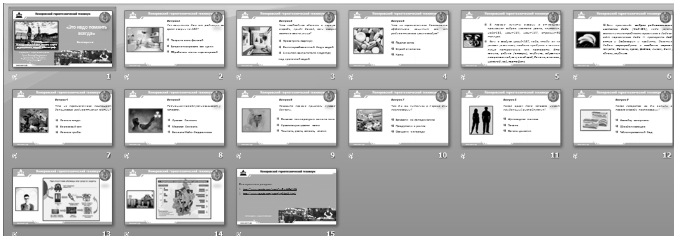
Видео фрагмент «Как это было авария на Чернобыльской АЭС».